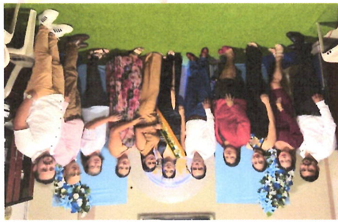
Desfile de Parroquialización de Torata.