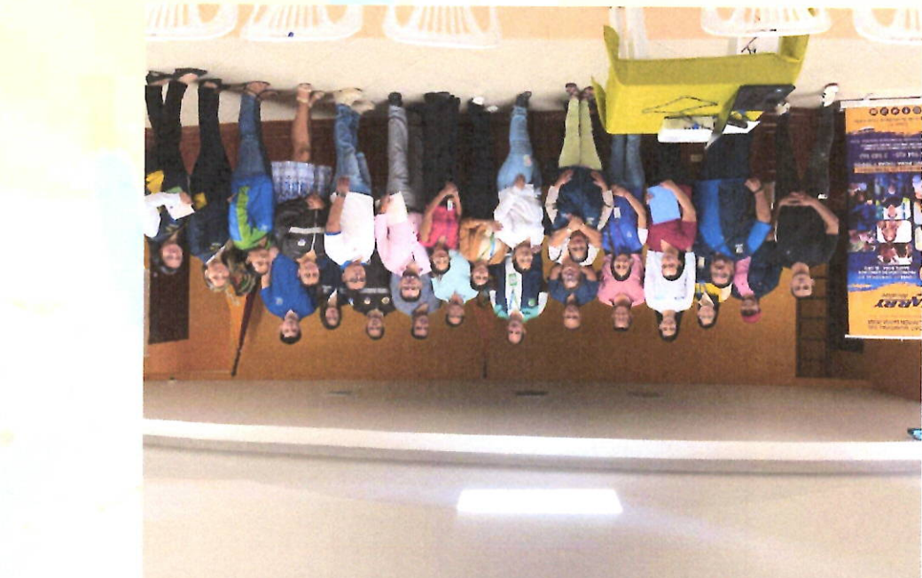
Visita al taller grupal del sitio el Playón donde los beneficiarios desarrollan la actividad de secuencia lógica mejorando su agilidad mental.