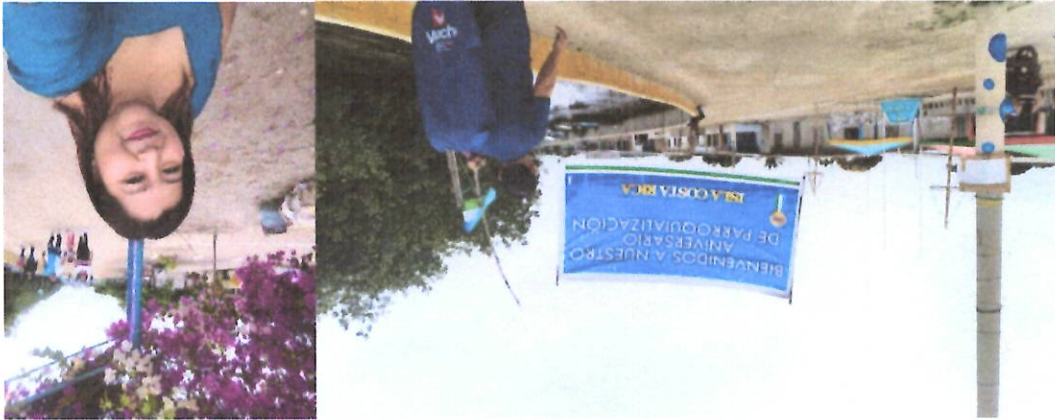
Invitada a la sesión solemne de la isla Costa Rica.