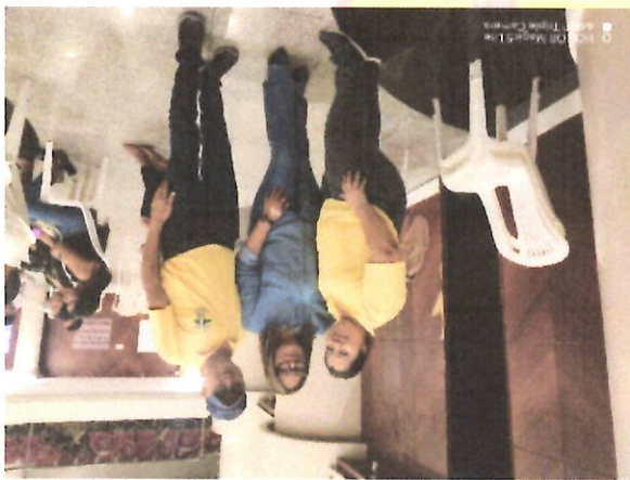
Seguimiento de Labores a la Promotora Andea Cherez al taller grupal donde realiza actividad recreativa de canto.