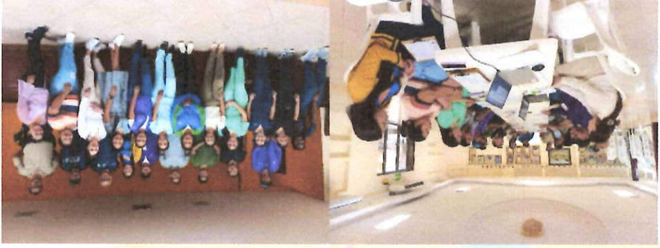
Asistencia mesa intersectorial cantonal denominada Ecuador crece sin desnutrición infantil.