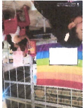
Delegada a reunión del lanzamiento del documental de la comunidad LGTBQ+