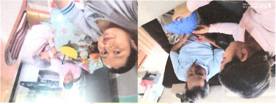
Acompañamiento a las visitas domiciliarias para trabajar en manualidades de una canasta y flores de foamix.